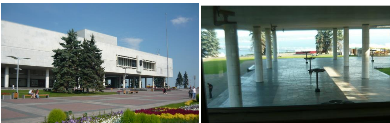
2. Мемориал В.И.Ленину: А) Южный фасад; Б) Вид на восток из окна 2го этажа; не подобный ли образ вдохновил юного В.И.Ульянова на будущие революционные дела?